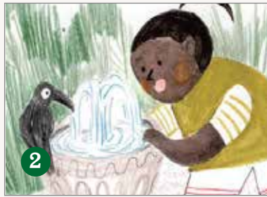
2 高 高 的 洗 手 臺 ( )