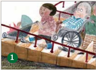
1 無 障 礙 坡 道 ( )

一、 選 選 看 看， 哪 些 是 友 善 的 空 間 設 施 呢？( 是 友 善 的 畫 ○ ， 不 是 友 善 的 畫 × )