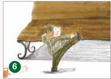
6 高 高 的 涼 椅 ( )

二、 想 一 想， 生 活 中 會 遇 到 哪 些 不 方 便？ 可 以 畫 畫 看 看， 畫 出 解 決 不 方 便 的 好 點 子。