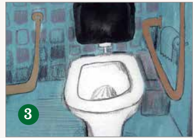
3 無 障 礙 廁 所 ( )