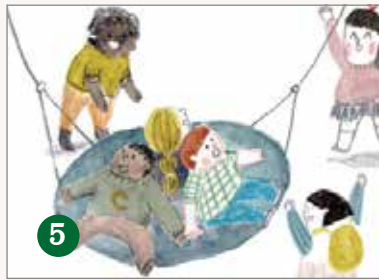
5 鳥 巢 秋 千 ( )