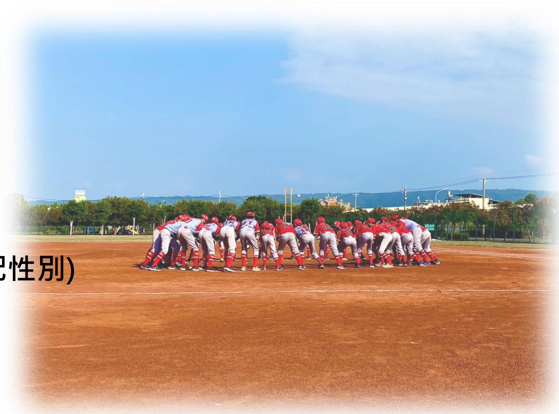
永靖簡易棒球場現況