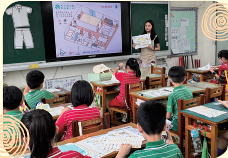
志工帶領孩子們進行 家事小秘笈導讀活動