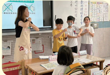
大家一起來把濕濕的抹布擰乾！