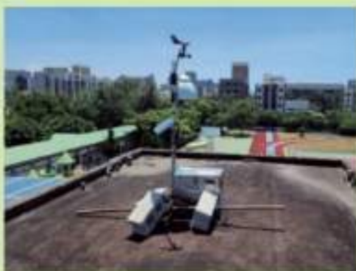
空氣感測器（包括風速、風向計）