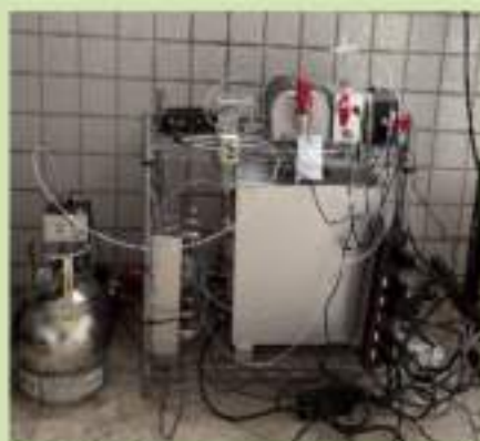
監測儀器及桶採樣