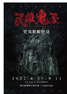
民雄鬼屋實境體驗特展