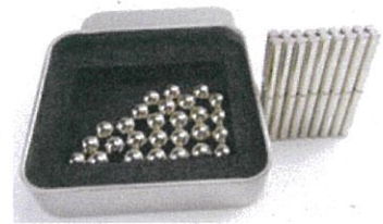
磁性玩具 (如:巴克球益智磁鐵組)