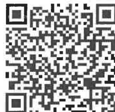
過往六福永續獎影片