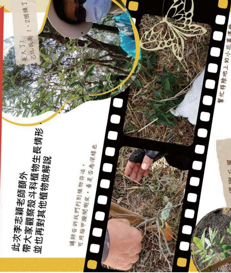
幫忙移除地上的小花蔓澤蘭