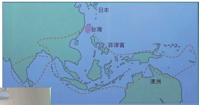
世界分布（虛線），台灣族群所屬亞種分布範圍

紫斑蝶的生態，在台灣的遷徙、各種類的辨認、生活史、寄主植物與蜜源食物。認識紫斑蝶的口訣：「小紫點一點，圓翅點兩邊，斯式點三點，端紫亂亂點。」