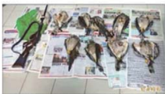
國慶鳥過境遭盜獵 先射傷再摔死

▲灰面鵟鷹過境遭盜獵，先射傷再摔死。圖為下午在彰化地區發現的數隻死鳥，其中一隻被摔死，多隻灰面鵟鷹被摔死中。