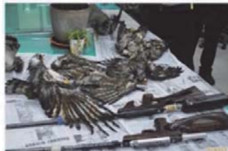
盜獵試槍？國慶鳥棲地反光鏡被打凹

▲國慶鳥棲地反光鏡被打凹，疑有盜獵者試槍。圖為盜獵者試槍後，國慶鳥棲地反光鏡被打凹。