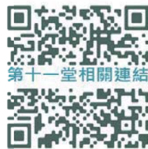
第十一堂相關連結