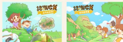
第一本「出門走走吧」 第二本「戶外教學篇」

開發 4 本 AR 繪本「地震來了！」，提供 AR 技術進行地質災害境況模擬技術，享受立體視覺浸淫體驗，以建立學生面對災害時的思維能力與判斷能力，進一步深化防災知識技能。