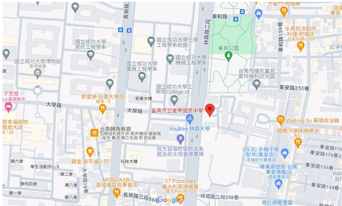
(後甲國中 google 地圖)