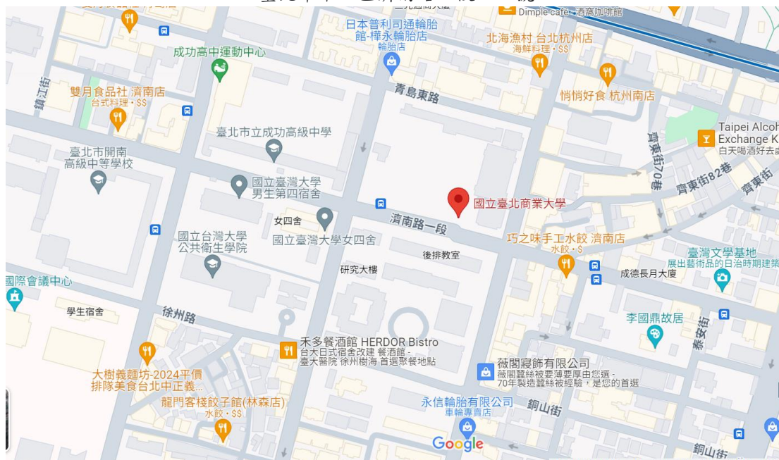
(臺北商業大學 google 地圖)