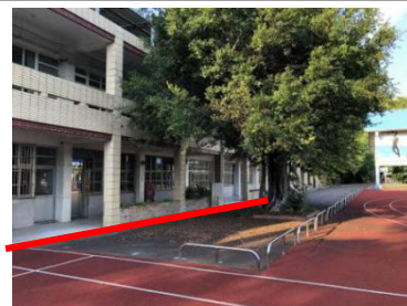
車棚旁樹木區落葉、垃圾掃除