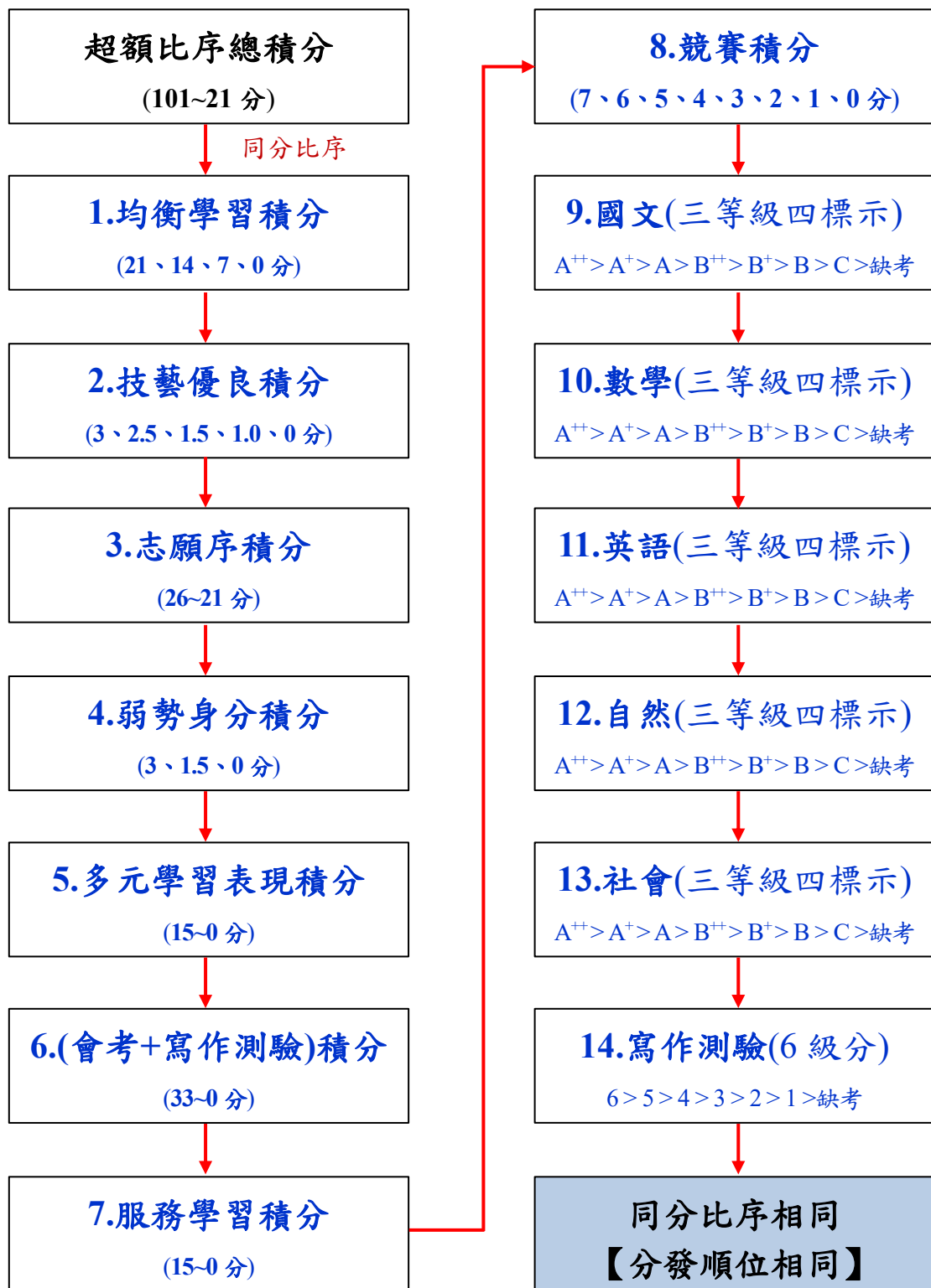
表 4-1 分發順位排定原則及同分比序順序

註：無論該科（組）是否採計國中教育會考，於同分比序皆為一致標準，均包含國中教育會考科目之比序。