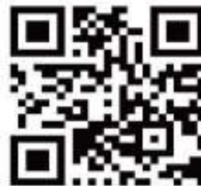
「台北海洋科技大學QR code」