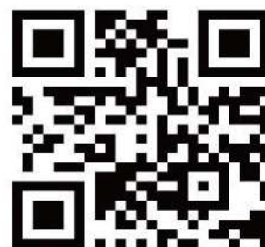
「台北海洋科技大學QR code」