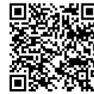
本校性平教育宣導網