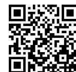
性別平等教育全球資訊網