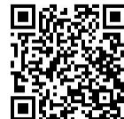
本校生命教育宣導網