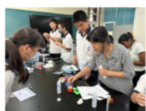
彰師大教授志工 實驗課程