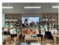
全新共讀站真人圖書館