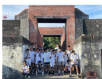
籃球隊移地訓練： 結合戶外教學西子灣巡禮