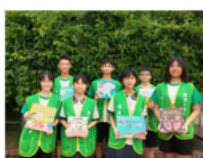
閱讀小推手繪本說故事