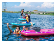
海洋教育： SUP直立板體驗