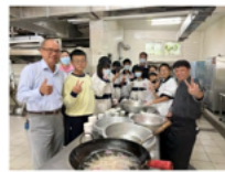
冬至湯圓融合校園