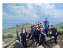
棒球隊移地訓練： 結合戶外教學七星山登頂