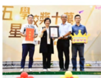
縣府表揚五星旗艦學校 「品德教育領航學校」