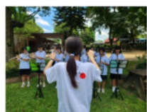
管樂社戶外教學巡迴： 新埔客家園區