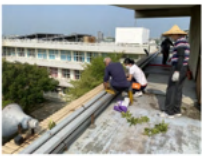
定期維護頂樓環境