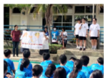
口說英語推廣教育EPT