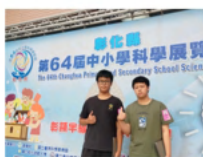
科展參賽連年獲獎 (數學全縣第二名)